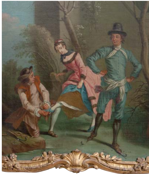
D'après Nicolas Lancret, L'hiver, les patineurs (dessus de porte), dépôt du Musée des arts décoratifs de Paris